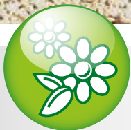
Soin des végétaux